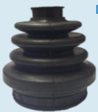
FUELLE MONZA CHINOS CHICOS (LADO CAJA)

DIAM SUPERIOR 21 MM DIAM INFERIOR 62MM ALTURA 91 MM