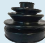
FUELLE TERRANO RUEDA

DIAM SUPERIOR 32 MM DIAM INFERIOR 93MM ALTURA 81 MM