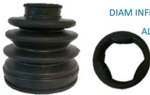
FUELLE TIIDA SAIL LADO CAJA