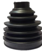
FUELLE CITY-CARS, KIA MORNING, CHEVR SPARK TODOS , HYUNDAI I-10, EOM Y OTROS (LADO RUEDA )

DIAM SUPERIOR 21 MM DIAM INFERIOR 73 MM ALTURA 94 MM