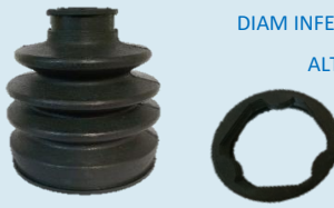
FUELLE CHEVROLET XTRAIL LADO CAJA