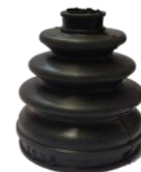
FUELLE LADA SAMARA - V16 COPA CHICA

DIAM SUPERIOR 20 MM DIAM INFERIOR 80 MM ALTURA 107 MM