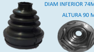
FUELLE FORD FIESTA (CAJA)

DIAM SUPERIOR 22 MM DIAM INFERIOR 74MM ALTURA 90 MM