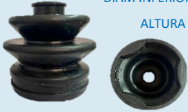
FUELLE PEUGEOT 206-207 LADO RUEDA

DIAM SUPERIOR 22MM DIAM INFERIOR 69MM ALTURA 102MM