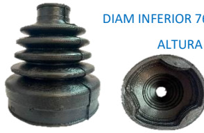
FUELLE CHEVROLET CAVALIER (CAJA)

DIAM SUPERIOR 35.3MM DIAM INFERIOR 76.5MM ALTURA 94MM