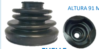
FUELLE TERRANO (CAJA)

DIAM SUPERIOR 36 MM DIAM INFERIOR 91 MM ALTURA 91 MM