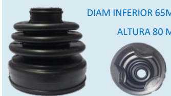
FUELLE CITY-CARS, KIA MORNING, CHEVR SPARK TODOS , HYUNDAI I-10, EOM Y OTROS (LADO CAJA CON TRICETAS)

DIAM SUPERIOR 20 MM DIAM INFERIOR 65MM ALTURA 80 MM